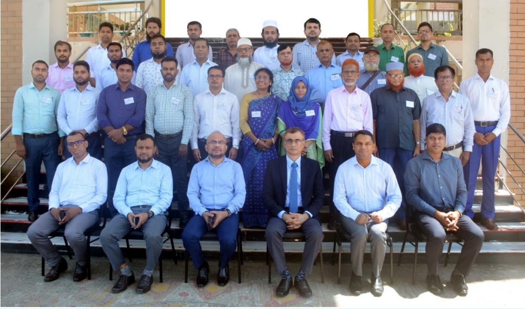
বিয়াম ফাউন্ডেশন আঞ্চলিক কেন্দ্র, কক্সবাজার এর অনুযদ সদস্যবৃন্দ ও সম্মানিত অতিথিবৃন্দের সাথে অর্থ বিভাগ, অর্থ মন্ত্রণালয় এর সঞ্জীবনী প্রশিক্ষণ কোর্স (১ম ব্যাচ) এর প্রশিক্ষণার্থীবৃন্দ।

বাংলাদেশ ইনস্টিটিউট অব এ্যাডমিনিস্ট্রেশন এ্যান্ড ম্যানেজমেন্ট (বিয়াম) ফাউন্ডেশন আঞ্চলিক কেন্দ্র, কক্সবাজারে গত ২৪ সেপ্টেম্বর, ২০২৩ হতে ১৬ নভেম্বর, ২০২৩ তারিখ পর্যন্ত ০৬ (ছয়) টি ব্যাচে ৫ (পাঁচ) দিন মেয়াদি অর্থ বিভাগ, অর্থ মন্ত্রণালয় এর কর্মকর্তা/কর্মচারীদের সঞ্জীবনী প্রশিক্ষণ কোর্স সফলতার সাথে সম্পন্ন হয়। সর্বমোট ১৭৮ (একশত আটাত্তর) জন প্রশিক্ষণার্থী উল্লেখিত প্রশিক্ষণ কোর্সে অংশগ্রহণ করেন।