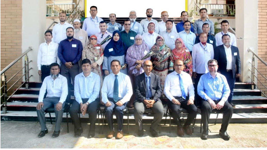
বিয়াম ফাউন্ডেশন আঞ্চলিক কেন্দ্র, কক্সবাজার এর অনুষদ সদস্যবৃন্দ ও সম্মানিত অতিথিবৃন্দের সাথে বাংলাদেশ ট্রেড এন্ড ট্যারিফ কমিশন এর সঞ্জীবনী প্রশিক্ষণ কোর্স (১ম ব্যাচ) এর প্রশিক্ষণার্থীবৃন্দ।