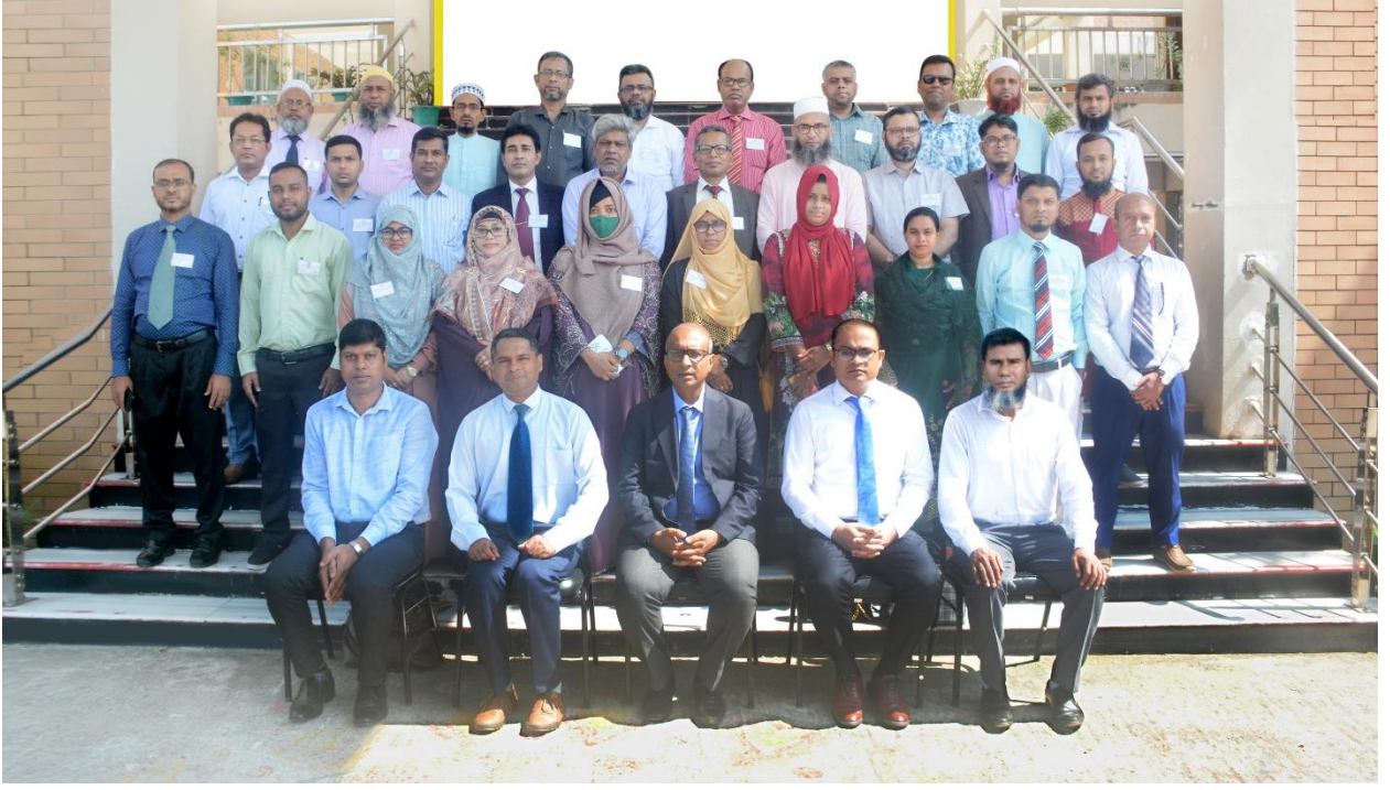
বিয়াম ফাউন্ডেশন আঞ্চলিক কেন্দ্র, কক্সবাজার এর অনুযদ সদস্যবৃন্দ ও সম্মানিত অতিথিবৃন্দের সাথে অর্থ বিভাগ, অর্থ মন্ত্রণালয় এর সঞ্জীবনী প্রশিক্ষণ কোর্স (৫ম ব্যাচ) এর প্রশিক্ষণার্থীবৃন্দ।