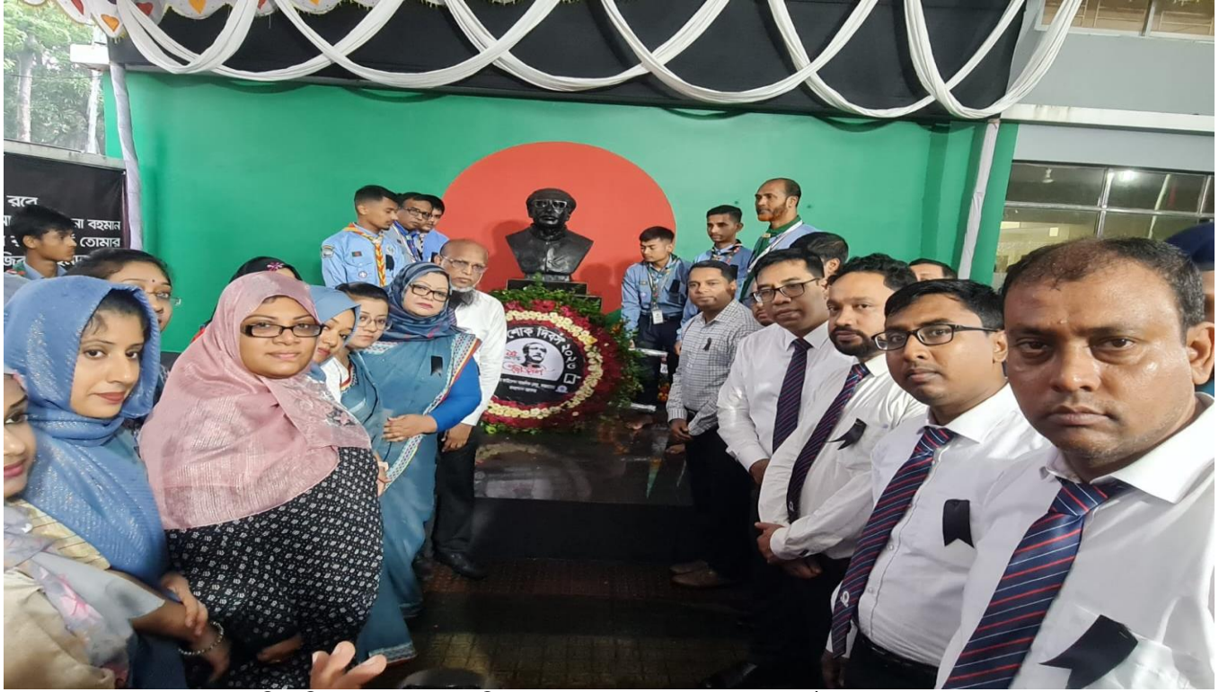
স্বাধীনতার মহান স্থপতি জাতির পিতা বঙ্গবন্ধু শেখ মুজিবুর রহমান ঐর ৪৮তম শাহাদত বার্ষিকী ও জাতীয় শোক দিবস-২০২৩ উপলক্ষে বঙ্গবন্ধুর ম্যুরালে পুষ্পস্তবক অর্পণ