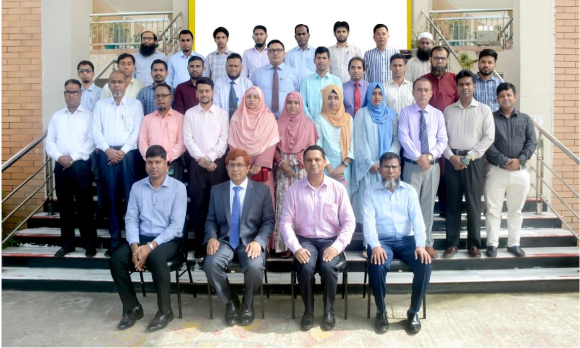
বিয়াম ফাউন্ডেশন আঞ্চলিক কেন্দ্র, কক্সবাজার এর অনুযদ সদস্যবৃন্দ ও সম্মানিত অতিথিবৃন্দের সাথে অর্থ বিভাগ, অর্থ মন্ত্রণালয় এর সঞ্জীবনী প্রশিক্ষণ কোর্স (৪র্থ ব্যাচ) এর প্রশিক্ষণার্থীবৃন্দ।