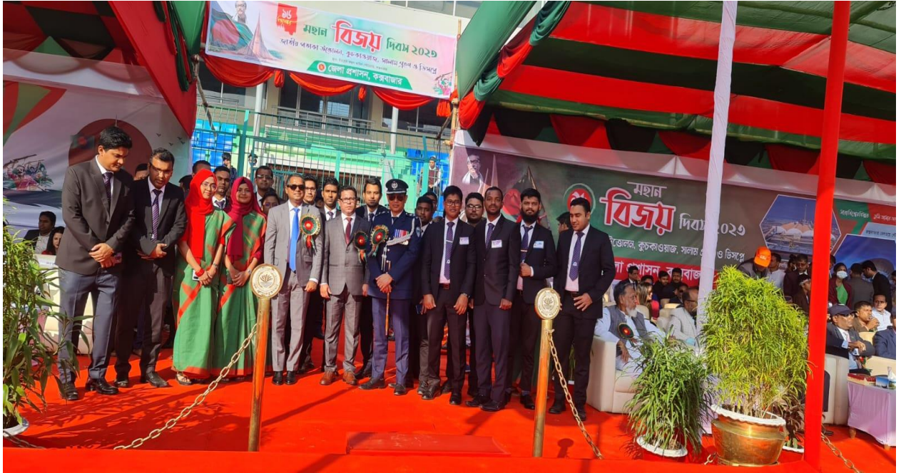
মহান বিজয় দিবস-২০২৩ উপলক্ষে জেলা প্রশাসন কর্তৃক আয়োজিত পতাকা উত্তোলন, কুচকাওয়াজ, সালাম ও ডিসপ্লিতে অংশগ্রহণ