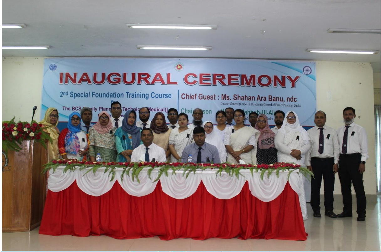
২য় বিশেষ বুনিয়াদি প্রশিক্ষণ কোর্সের উদ্বোধনী অনুষ্ঠান