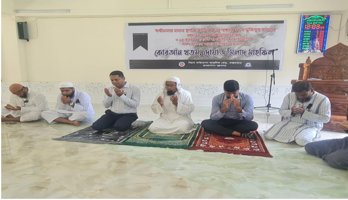
স্বাধীনতার মহান স্থপতি জাতির পিতা বঙ্গবন্ধু শেখ মুজিবুর রহমান এর ৪৮তম শাহাদত বার্ষিকী ও জাতীয় শোক দিবস-২০২৩ উপলক্ষে বিশেষ দোয়া ও মিলাদ মাহফিল