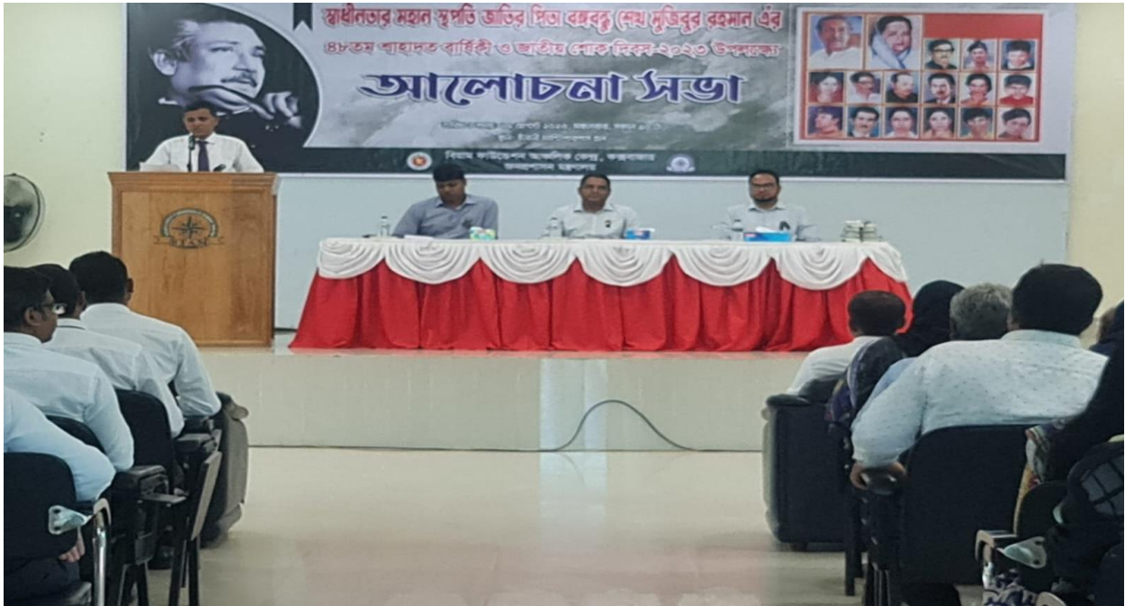
স্বাধীনতার মহান স্থপতি জাতির পিতা বঙ্গবন্ধু শেখ মুজিবুর রহমান এর ৪৮তম শাহাদত বার্ষিকী ও জাতীয় শোক দিবস-২০২৩ উপলক্ষে আলোচনা সভা