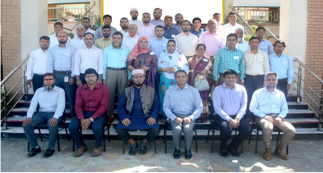
বিয়াম ফাউন্ডেশন আঞ্চলিক কেন্দ্র, কক্সবাজার এর অনুষদ সদস্যবৃন্দ ও সম্মানিত অতিথিবৃন্দের সাথে বিভাগীয় কমিশনারের কার্যালয়, ঢাকা এর সঞ্জীবনী প্রশিক্ষণ কোর্স এর প্রশিক্ষণার্থীবৃন্দ।

বাংলাদেশ ইনস্টিটিউট অব এ্যাডমিনিস্ট্রেশন এ্যান্ড ম্যানেজমেন্ট (বিয়াম) ফাউন্ডেশন আঞ্চলিক কেন্দ্র, কক্সবাজারে গত ০১ অক্টোবর, ২০২৩ হতে ০৫ অক্টোবর, ২০২৩ তারিখ পর্যন্ত ৫ (পাঁচ) দিন মেয়াদি বিভাগীয় কমিশনারের কার্যালয়, ঢাকা এর কর্মকর্তা/কর্মচারীদের সঞ্জীবনী প্রশিক্ষণ কোর্স সফলতার সাথে সম্পন্ন হয়। সর্বমোট ২৯ (উনত্রিশ) জন প্রশিক্ষণার্থী উল্লেখিত প্রশিক্ষণ কোর্সে অংশগ্রহণ করেন।