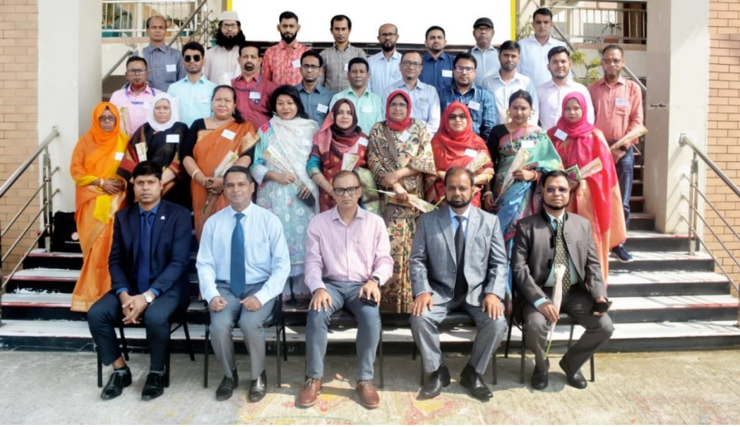
বিয়াম ফাউন্ডেশন আঞ্চলিক কেন্দ্র, কক্সবাজার এর অনুষদ সদস্যবৃন্দ ও সম্মানিত অতিথিবৃন্দের সাথে বাংলাদেশ ট্রেড এন্ড ট্যারিফ কমিশন এর সঞ্জীবনী প্রশিক্ষণ কোর্স (২য় ব্যাচ) এর প্রশিক্ষণার্থীবৃন্দ।