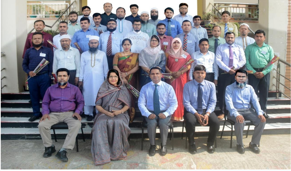
বিয়াম ফাউন্ডেশন আঞ্চলিক কেন্দ্র, কক্সবাজার এর অনুযদ সদস্যবৃন্দ ও সম্মানিত অতিথিবৃন্দের সাথে অর্থ বিভাগ, অর্থ মন্ত্রণালয় এর সঞ্জীবনী প্রশিক্ষণ কোর্স (৩য় ব্যাচ) এর প্রশিক্ষণার্থীবৃন্দ।