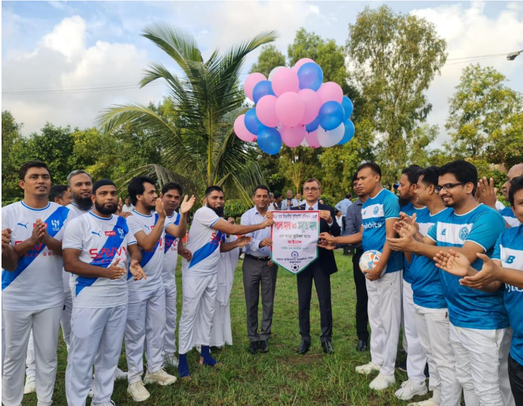
২৫তম বিভাগীয় বুনিয়াদি প্রশিক্ষণ কোর্স এর প্রশিক্ষণার্থীবৃন্দের ফুটবল ম্যাচ