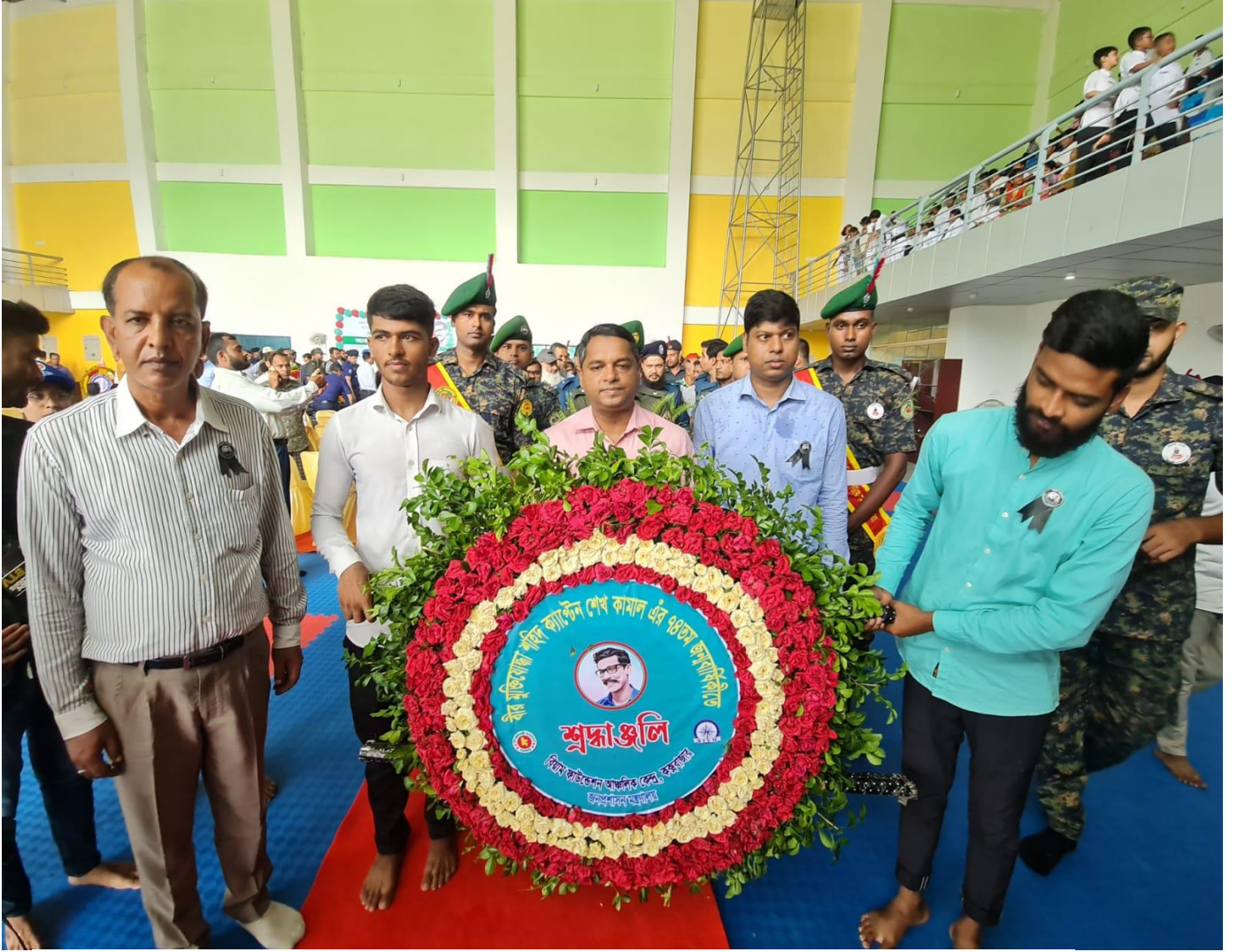
জাতির পিতা বঙ্গবন্ধু শেখ মুজিবুর রহমান ঐর জ্যেষ্ঠ পুত্র বীর মুক্তিযোদ্ধা শহীদ ক্যাপ্টেন শেখ কামাল এর ৭৪তম জন্মবার্ষিকী উদযাপন উপলক্ষে শেখ কামাল এর প্রতিকৃতিতে পুষ্পস্তাবক অর্পণ