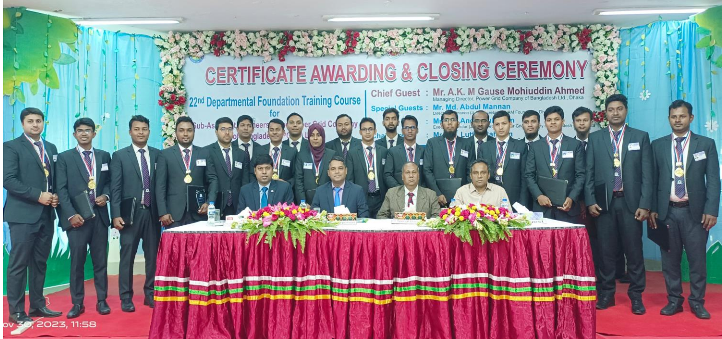
২য় বিশেষ বুনিয়াদি প্রশিক্ষণ কোর্সের সার্টিফিকেট বিতরণ ও সমাপনী অনুষ্ঠান