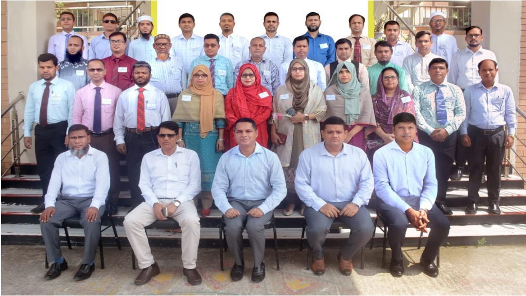
বিয়াম ফাউন্ডেশন আঞ্চলিক কেন্দ্র, কক্সবাজার এর অনুযদ সদস্যবৃন্দ ও সম্মানিত অতিথিবৃন্দের সাথে অর্থ বিভাগ, অর্থ মন্ত্রণালয় এর সঞ্জীবনী প্রশিক্ষণ কোর্স (২য় ব্যাচ) এর প্রশিক্ষণার্থীবৃন্দ।