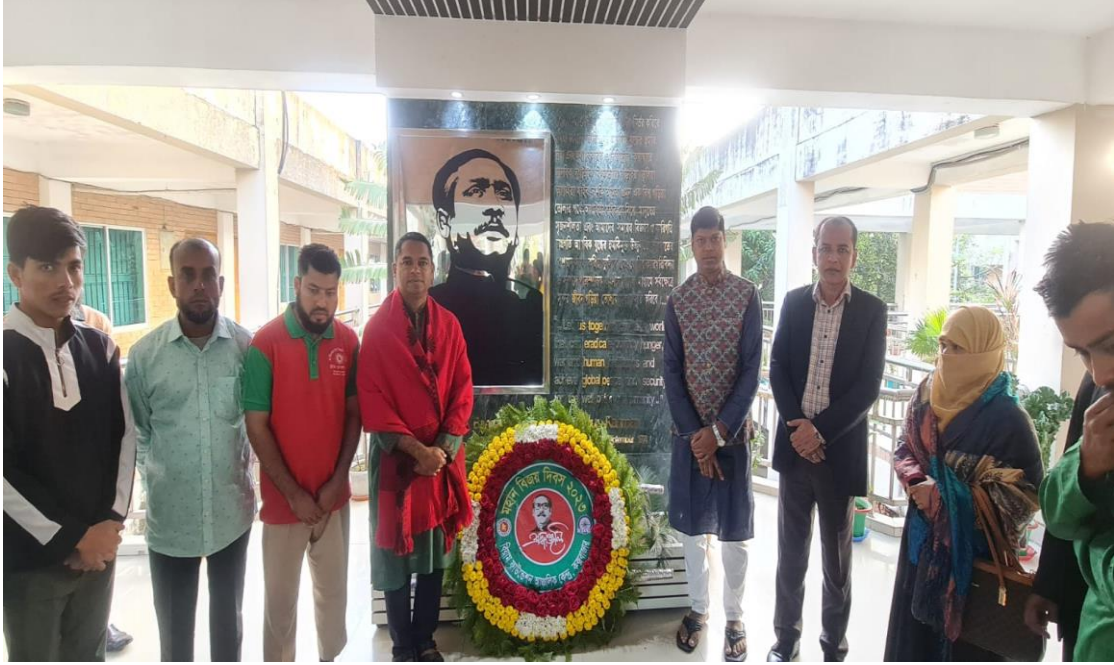
মহান বিজয় দিবস-২০২৩ উপলক্ষে বিয়াম ফাউন্ডেশন আঞ্চলিক কেন্দ্র, কক্সবাজারে স্থাপিত জাতির পিতা বঙ্গবন্ধু শেখ মুজিবুর রহমান ঐঁর ম্যুরালে পুষ্পস্তবক অর্পণ