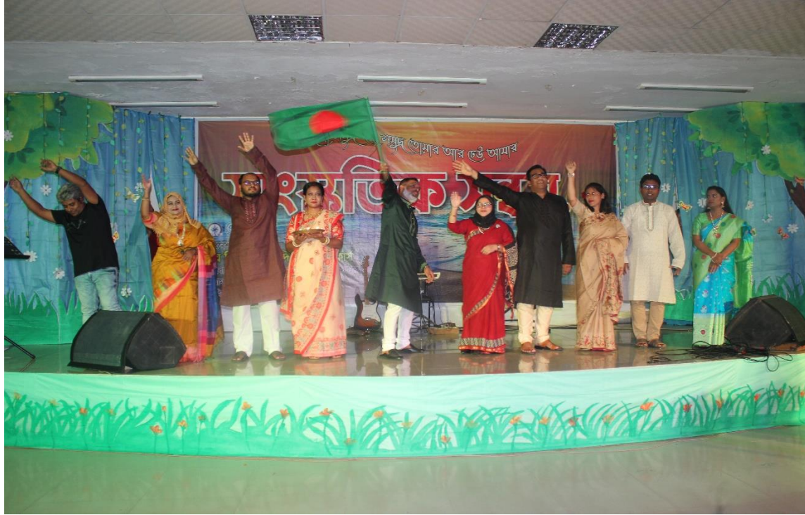
২য় বিশেষ বুনিয়াদি প্রশিক্ষণ কোর্সের প্রশিক্ষণার্থীদের অংশগ্রহণে মনোজ্ঞ সাংস্কৃতিক অনুষ্ঠান