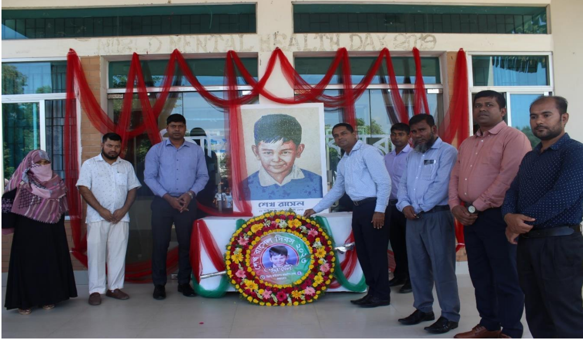
বিয়াম ফাউন্ডেশন আঞ্চলিক কন্ড্রে, কক্সবাজারের কর্মকর্তা-কর্মচারীদের শেখ রাসেল'র শুভ প্রতিকৃতিতে পুষ্পস্তাবক অর্পণ