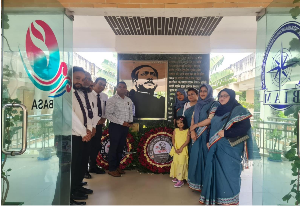
স্বাধীনতার মহান স্থপতি জাতির পিতা বঙ্গবন্ধু শেখ মুজিবুর রহমান ঐর ৪৮তম শাহাদত বার্ষিকী ও জাতীয় শোক দিবস-২০২৩ উপলক্ষে বিয়াম ফাউন্ডেশন আঞ্চলিক কেন্দ্র, কক্সবাজার এ অবস্থিত জাতির পিতা বঙ্গবন্ধু শেখ মুজিবুর রহমান ঐর মুরালে পুষ্পস্তবক অর্পণ