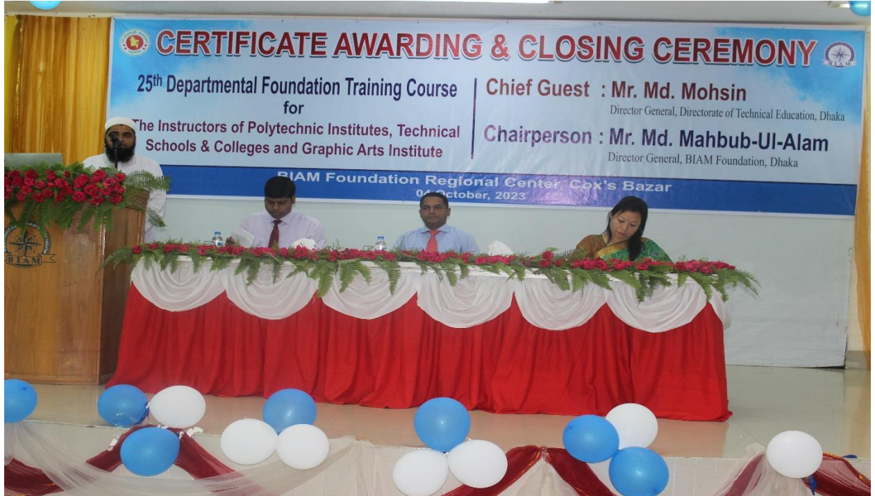
২য় বিভাগীয় বুনিয়াদি প্রশিক্ষণ কোর্সের সার্টিফিকেট বিতরণ ও সমাপনী অনুষ্ঠান