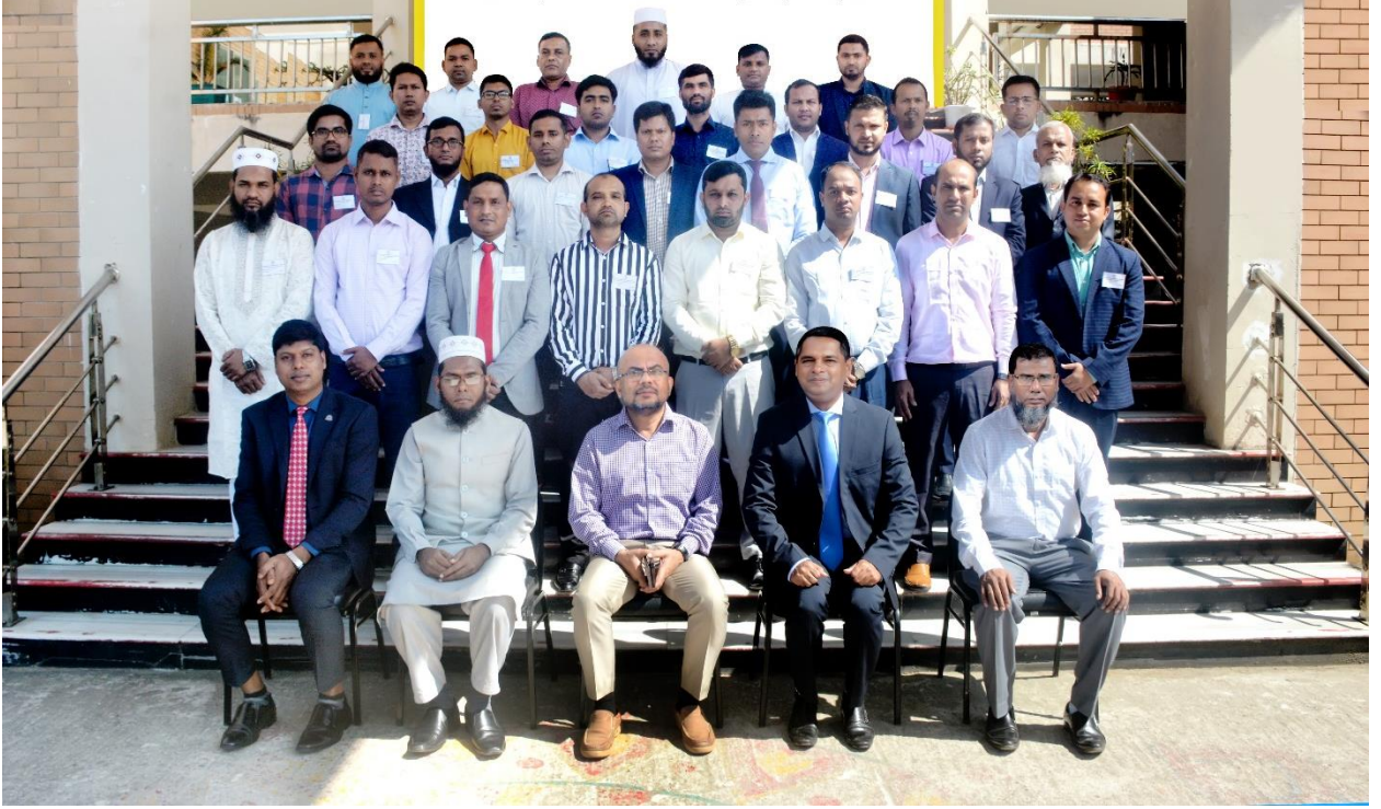
বিয়াম ফাউন্ডেশন আঞ্চলিক কেন্দ্র, কক্সবাজার এর অনুযদ সদস্যবৃন্দ ও সম্মানিত অতিথিবৃন্দের সাথে অর্থ বিভাগ, অর্থ মন্ত্রণালয় এর সঞ্জীবনী প্রশিক্ষণ কোর্স (৬ষ্ঠ ব্যাচ) এর প্রশিক্ষণার্থীবৃন্দ।