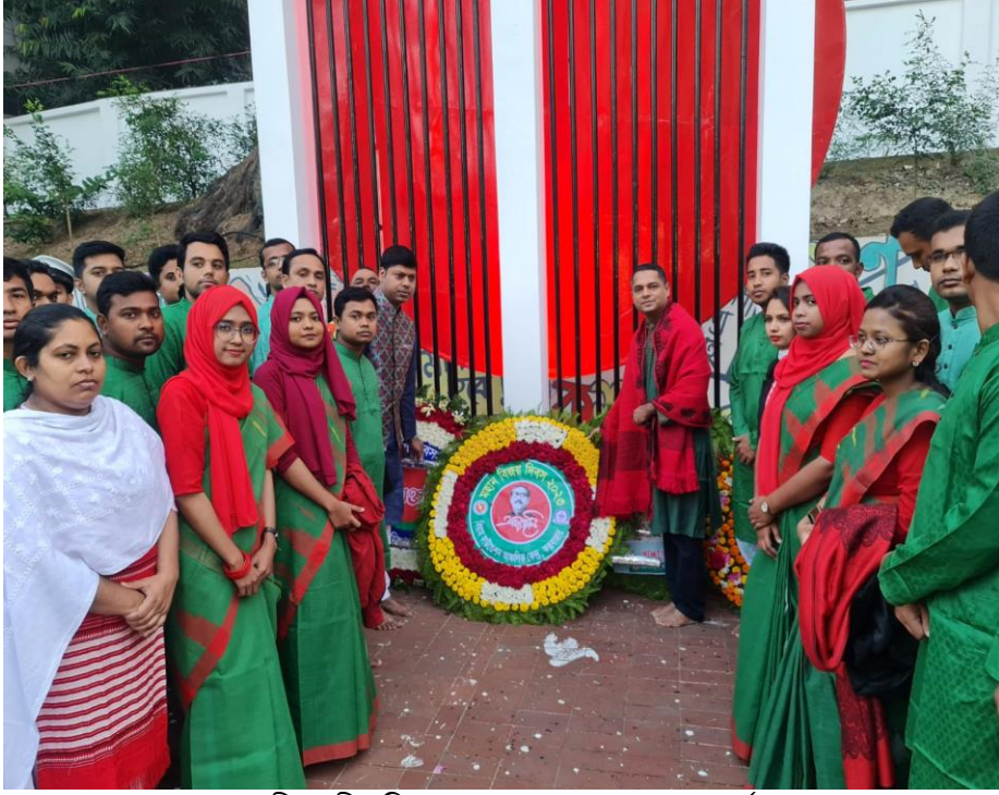
কেন্দ্রীয় শহীদ মিনার, কক্সবাজার-এ পুষ্পস্তবক অর্পণ