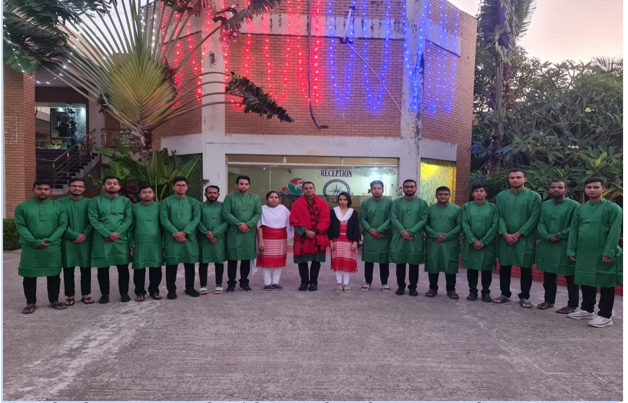
মহান বিজয় দিবস-২০২৩ উপলক্ষে জাতীয় কর্মসূচির সাথে সংগতি রেখে বিয়াম ফাউন্ডেশন আঞ্চলিক কেন্দ্র, কল্লবাজার এর ক্যাম্পাস বর্ণিল সাজে আলোকসজ্জাকরণ