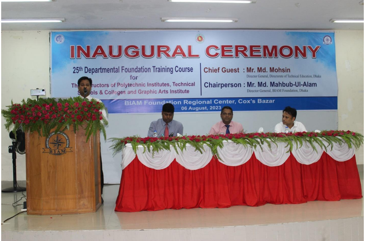
২৫তম বিভাগীয় বুনিয়াদি প্রশিক্ষণ কোর্সের উদ্বোধনী অনুষ্ঠান