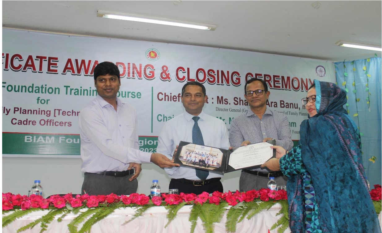
২য় বিশেষ বুনিয়াদি প্রশিক্ষণ কোর্সের সার্টিফিকেট বিতরণ ও সমাপনী অনুষ্ঠান