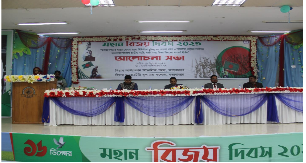
মহান বিজয় দিবস-২০২৩ উপলক্ষে “জাতির পিতার স্বপ্নের সোনার বাংলা বিনির্মাণে মুক্তিযুদ্ধের চেতনা ধারণ ও ডিজিটাল প্রযুক্তির সর্বোত্তম ব্যবহারের মাধ্যমে জাতীয় সমৃদ্ধি অর্জন এবং বিজয় দিবসের তাৎপর্য শীর্ষক” আলোচনা সভা