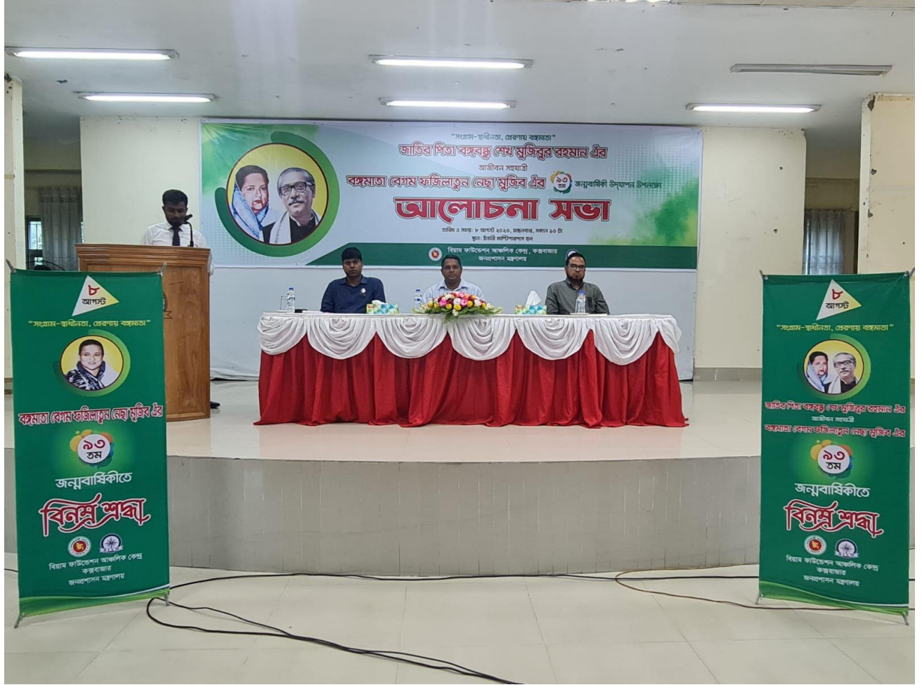
বঙ্গমাতা শেখ ফজিলাতুন নেছা মুজিব ঐর ১৩ তম জন্মবার্ষিকী উদ্‌যাপন উপলক্ষ্যে আলোচনা সভা