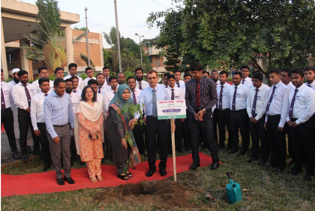
বৃক্ষরোপণ করছেন মহাপরিচালক, বিয়াম ফাউন্ডেশন, ঢাকা ও তাঁর সহধর্মিণী

পাওয়ার গ্রিড কোম্পানি অব বাংলাদেশ লিমিটেড এর উপ-সহকারী প্রকৌশলী কর্মকর্তাগণের ২২তম বিভাগীয় বুনিয়াদী প্রশিক্ষণ কোর্স