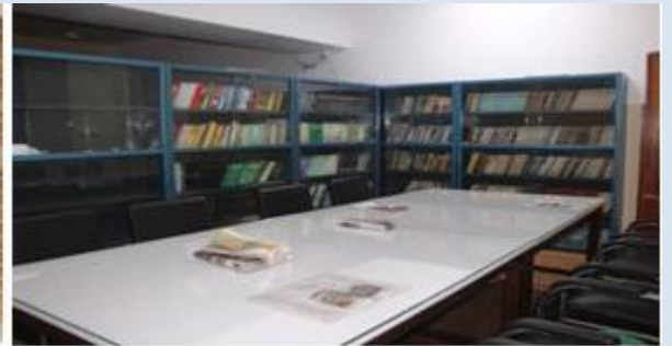
বিয়াম ফাউন্ডেশন আঞ্চলিক কেন্দ্র, বগুরায় অফিস ভবনের নিচ তলায় নিজস্ব অর্থায়নে ৪০ আসন বিশিষ্ট একটি আধুনিক মানের শীতাতাপ নিয়ন্ত্রিত সাউন্ডপুফ লাইব্রেরী নির্মান করা হয়েছে।